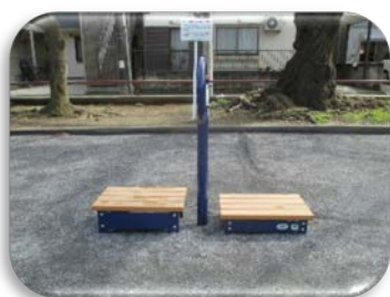
【脚伸ばし】 ・足(もも)のストレッチ

今は、家の中で過ごす時間が増えていますが、日頃の公園清掃や、花壇の管理など、愛議会活動は体力が必要ですし、健康なカラダを維持していくためにも公園での朝のラジオ体操やグランドゴルフなどの運動でカラダを動かしている方も多いと聞きますが、身近な公園にある健康遊具を使って体力づくりに役立ててみませんか？